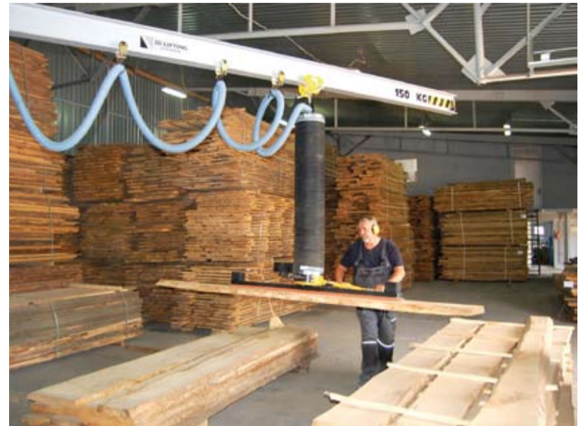
Urządzenie w postaci podciśnieniowego manipulatora było potrzebne do selekcjonowania materiału drzewnego.

głównie drewno liściaste. Od 60 do 80 proc. stanowi dąb, a reszta to takie gatunki, jak jesion i olcha oraz w mniejszej ilości klon i brzoza. W tym roku kupiliśmy też kilka set metrów sześciennych wiąz, dla jednego z klientów. Import, w ostatnich latach, to więcej niż połowa naszych zakupów. Na krajowym rynku oferuje się bowiem niewiele dobrej jakości tarcic liściastych, a na europejskim rynku drzewnym ceny są porównywalne. Więc dla nas mniej istotne