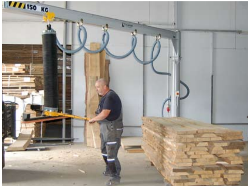
Manipulator MNP 150 jest zainstalowany na żurawiku niskiej zabudowy, z ramieniem o długości 5 m.