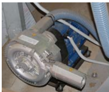
„Sercem” manipulatora jest wydajna i niezawodna, sucha pompa próżniowa.

Bardzo ciężka praca została znacząco ułatwiona. Przebiega teraz spraw-