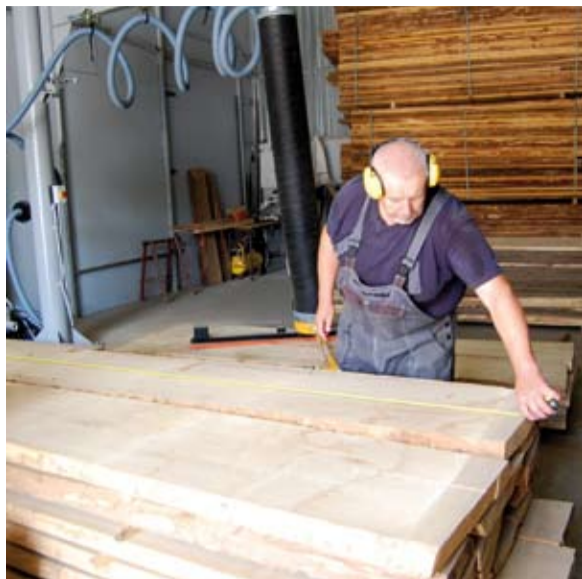
Brakarz dokonuje pomiaru długości i szerokości, ogląda wady i zapisuje dane na desce i na papierowym formularzu.